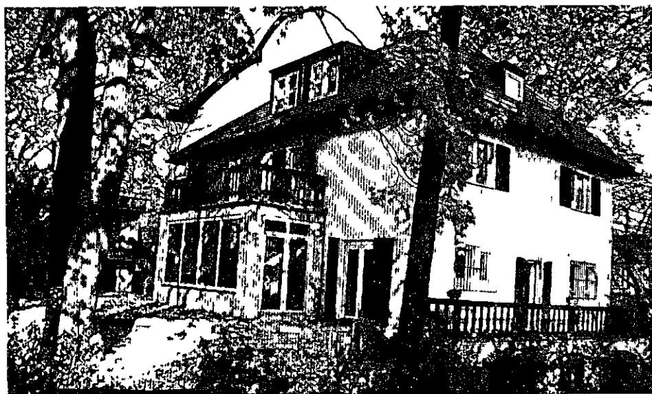
Abb. 58 Das Wohnhaus von der Gartenseite, 1991

Am 16. Juni 1938 wird die Wohnsiedlungsgenehmigung beim Bezirksbürgermeister von Zehlendorf beantragt, die am 22. Juli erteilt wird.