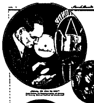
Abb. 63 Jochen Klepper in der Anzeige der Funkstunde, Dezember 1932

Abb. 64 Brief der Reichsschrifttumskammer an den Buchhandel, 1937