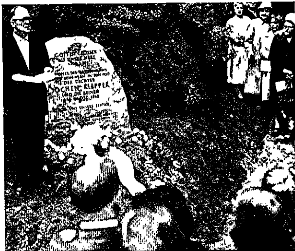
Abb. 71 Enthüllung des Gedenksteins in Nikolassee am 24. Juli 1961

Eva-Juliane Meschke, 1967 (Aus: Rudolf Wentorf [Hrsg.], Nicht klagen sollst du: loben. Jochen Klepper in memoriam , Gießen-Basel 1967.)