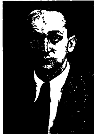
Abb. 60 Jochen Klepper